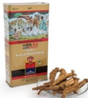
КОРЕЙСКИЙ КРАСНЫЙ ЖЕНЬШЕНЬ (Республика Корея)