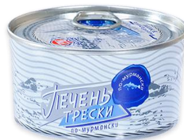
ПЕЧЕНЬ ТРЕСКИ ПО-МУРМАНСКИ (Мурманская область)