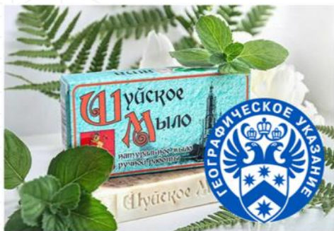
ШУЙСКОЕ МЫЛО (Ивановская область)

По состоянию на 25.11.2021 зарегистрировано 15 ГУ, среди которых