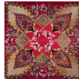
ТРОИЦКИЙ ПЛАТОК (Москва, г. Троицк)