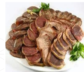
КАЗЫ ГОРНОГО АЛТАЯ (Республика Алтай)